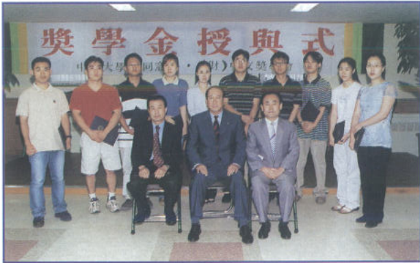
▲ 2000년 2학기 장학금을 수여한 후 기념사진을 촬영했다.