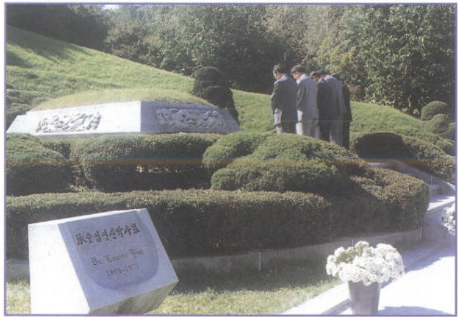
승당 임영신 박사 묘소를 참배하는 회장단