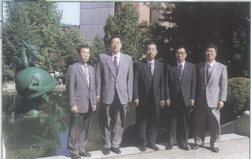
개교기념 행사가 진행되는 모교 청룡상 앞에서