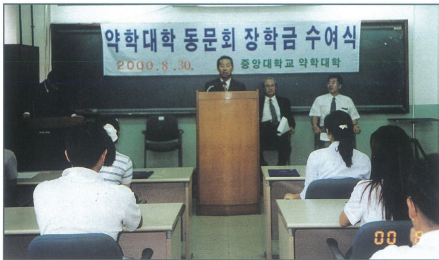
▲ 동문회 장학금 전달식

전반기 총20,392,500원, 후반기 총12,245,500가 전달되어 후배들의 면학분위기 조성 및 선후배 일체감 조성에 지대한 기여를 하고 있다.