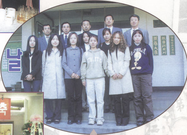
개교기념 행사가 진행되는 교정에서 모교 후배들과 함께한 회장단