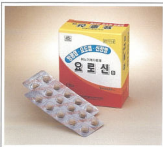
방광염, 요도염, 신장병