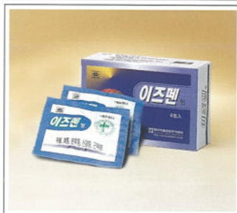
두통, 치통, 신경통, 생리통